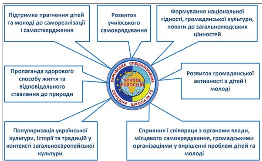
Рис. 2. Завдання євроклубу «Бджілка» Харківської спеціалізованої школи І–ІІІ ступенів Харківської міської ради Харківської області