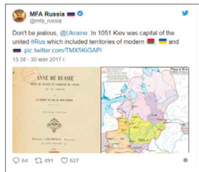
Рис. 4. Коментар сторінки МЗС РФ