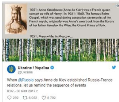
Рис. 1. Твіт української сторінки про Анну Ярославівну

Чинний президент США Дональд Трамп також регулярно використовує свій мікроблог у Twitter. Але дуже часто його дописи стають приводами для скандалів. Так, у листопаді 2017 р. Трамп поширив серію повідомлень ісламофобського характеру на своїй сторінці у Twitter від крайньо-правого екстремістського угруповання Britain First, викликавши хвилю критики від світової спільноти. У першому відео демонструється, як нібито «мусульманські мігранти б'ють голландського хлопчика на милицях». Друге відео має назву «Мусульманин руйнує статую Діви Марії», а в третьому демонструється, як «ісламістський