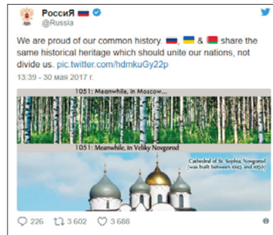
Рис. 2. Відповідь від Росії на перший твіт