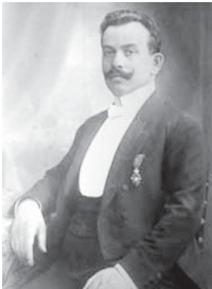
Якуб Файерштайн (Портрет невідомого автора. Дрогобич, 1910 р.) та особистий підпис від 26 грудня 1912 р.

Був чоловіком упертим, в розмові доступним не для кожного, особливо для тих, хто виходив за межі його власного «Я» [23, 3–4]. Його потужний нафтовий капітал працював «виключно на його ім'я, гонор, авторитет і бажання управляти усім» [23, 4]. З його діяльністю пов'язують зародження авторитаризму в середовищі магістрату та інших державних інстанцій міста, підкуплених «вовчою клікою Файерштайна» [23, 4]. Скажімо, впродовж 1909 – 1914 рр. голосування щодо бургомістра залежало, в основному, від волі Я. Файерштайна, оскільки його політична група обіймала більшість магістрату. Добре відомо, що чиновників різних державних інституцій міста, які не влаштовували Я. Файерштайна і його нафтову промислову групу, швидко усували з посад [5, 658]. У